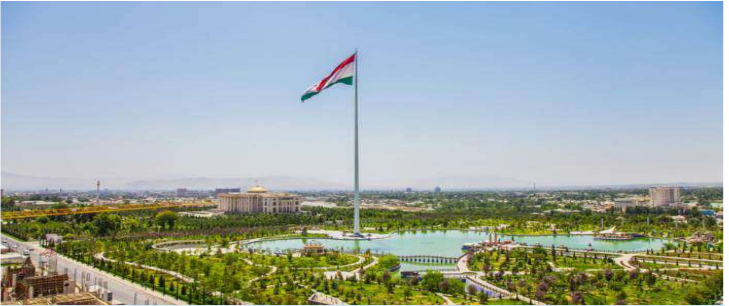
วันที่สิบ ดูซานเบ – ฮิสซาร์ – ดูซานเบ (ประเทศ ทาจิกิสถาน)

ใบอนุญาตประกอบธุรกิจนำเที่ยว เลขที่ 11/05862